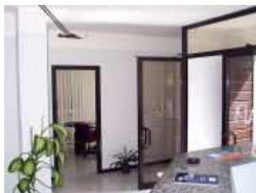
BORGOMANERO - Viale Marconi 115 borgomanero.info@apimpresa.it