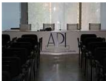
BAVENO - SS Sempione Km 87 vco@apimpresa.it

Associazione Piccole e Medie Industrie delle Province di Novara, V.C.O. e Vercelli